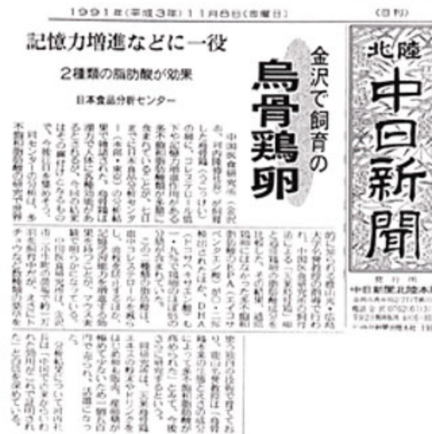
平成3年11月8日 北陸中日新聞