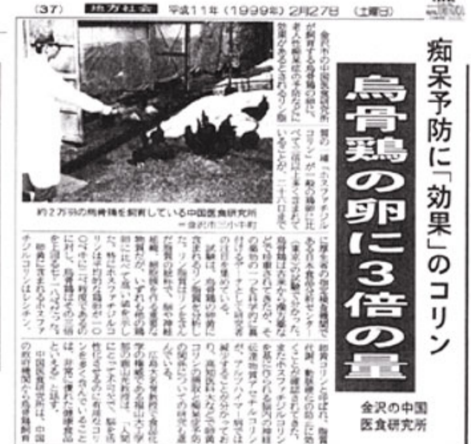
平成11年2月27日 北國新聞